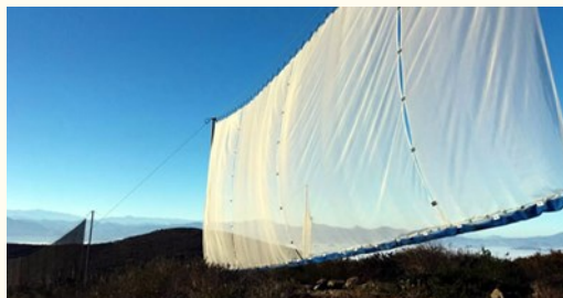
Imagen de Chile y la Universidad Católica del Norte dieron a conocer uso de tecnología que está revitalizando algunas comunidades del interior de la región.

De acuerdo al reciente estudio Radiografía del Agua, la zona de Copiapó a Los Vilos presenta el déficit hídrico más grande en magnitud del país, lo que en el contexto de cambio climático mundial está teniendo importantes repercusiones, afectando la ocupación humana del territorio y ámbitos culturales y económicos. De acuerdo al mismo informe, en 2015 Chile estuvo entre las 10 naciones con mayor gasto asociado a desastres, llegando a US$3.100 millones, de los cuales más del 45% fue destinado a cubrir situaciones de escasez hídrica.