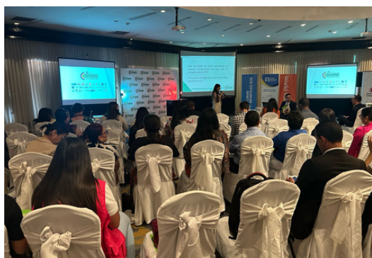
Presentes en el Informe de Niñez, brindado por la Red Coiprodén en el marco Cuarto Ciclo del Examen Periódico Universal-EPU.