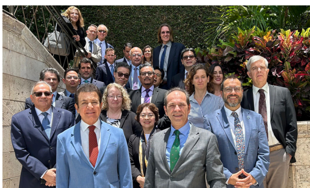
Reunión con candidato presidencial por el Partido Liberal, Sr. Salvador Nasralla.