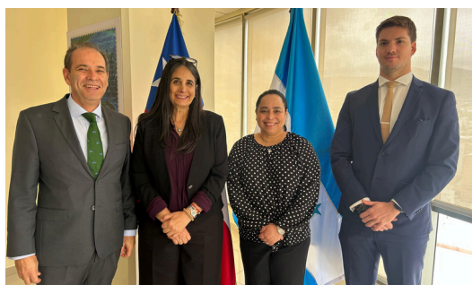
Visita de Cortesía ONU Mujeres.