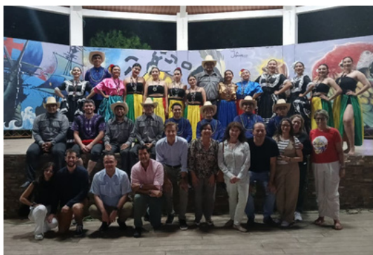
Asociación de Diplomáticos en Honduras propicia visita a Catacamas, Olancho.