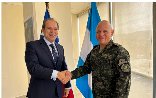
Embajador recibe saludos protocolares de Agregado de Defensa de Honduras en Chile.