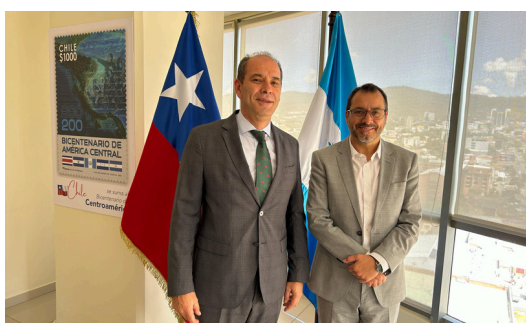
Visita de Cortesía del Coordinador Residente del Sistema de la ONU-Honduras.