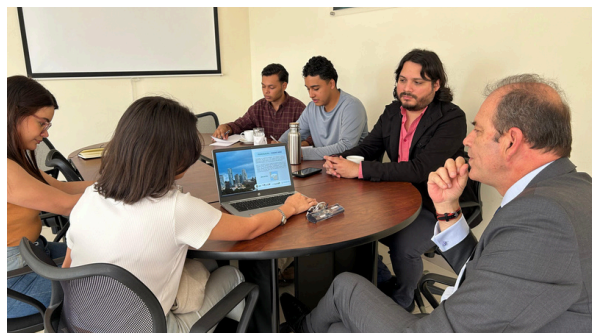
Visita de estudiantes de Química-UNAH.