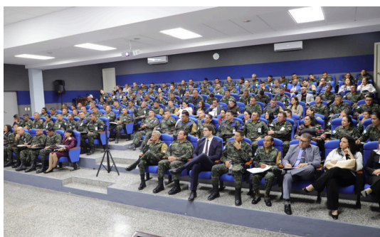
Conferencia en “Epistemología de la Inteligencia Estratégica”-UDH.