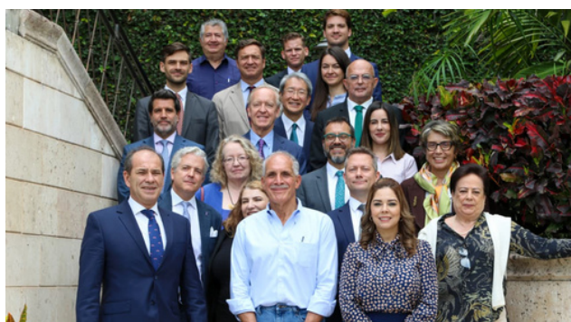
Reunión con candidato presidencial por el Partido Nacional, Sr. Nasry Asfura.