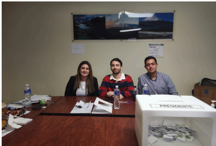
Elección Presidencial de Chile en Honduras, celebrada el 16 de noviembre.