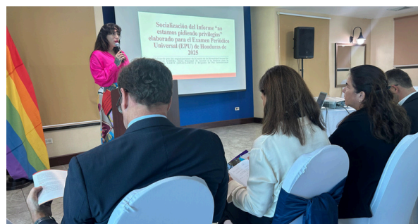
Presentación de Informe LGBTIQ+ en el marco del EPU 2025.