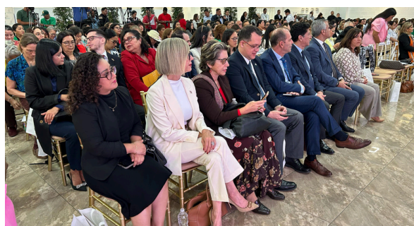
Presentes en Foro de la Mujer-CELAC.