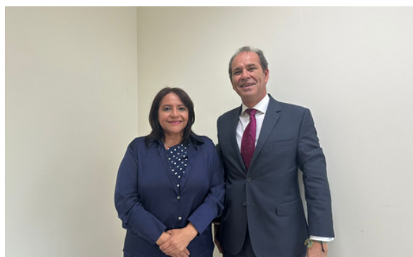
Fortalecimiento de temas de interés bilateral con la Secretaría de Agricultura y Ganadería (SAG).