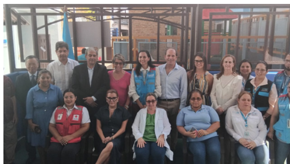
Presentes en la entrega de donación realizada por la Asociación de Diplomáticos en Honduras al CARM-Belén.