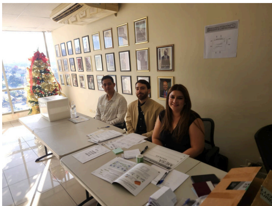
Segunda votación presidencial celebrada el 14 de diciembre.