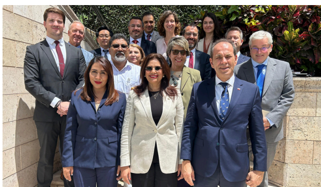
Reunión con candidata presidencial por el Partido LIBRE, Sra. Rixi Moncada.